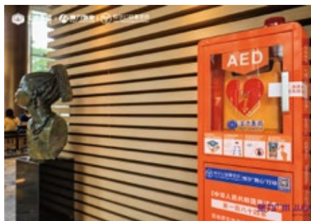
安装在广州富力中心首层大堂的AED设备