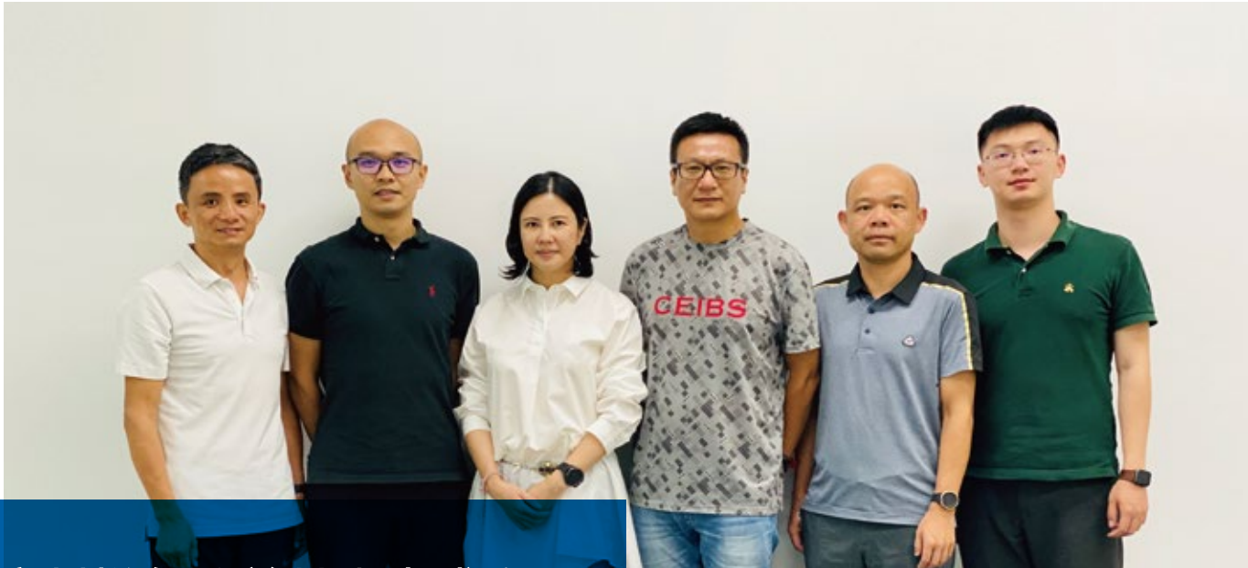
悦尔公益基金会创始理事与秘书处工作人员合影