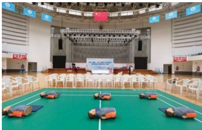
暨南大学珠海校区急救培训场地