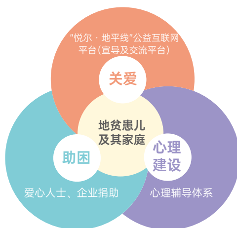
悦尔“地平线”项目主要服务模式