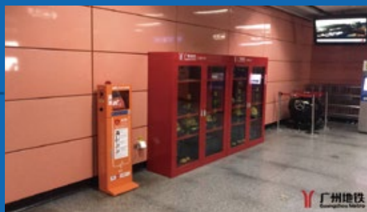
(图:设备投放后实拍图)