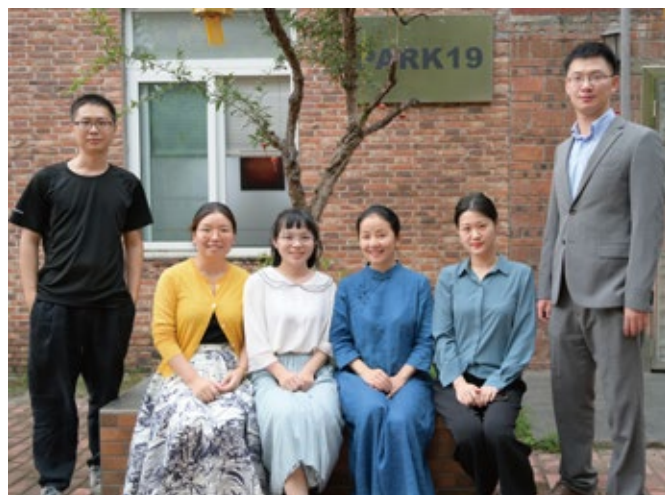
图：委托人与工作人员于PARK19合影留念

为探索可持续的资助模式，信托设置为永久存续，待政策等条件成熟时，受助艺术家可选择向慈善信托回捐“艺术品”，实现慈善资产与精神的传递。