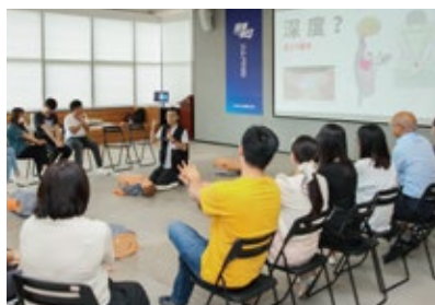
在校友企业华阳国际 开展急救培训