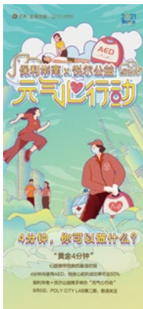
保利华南×悦尔公益 “元气心行动”宣传海报