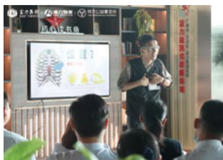
社区场景急救培训现场