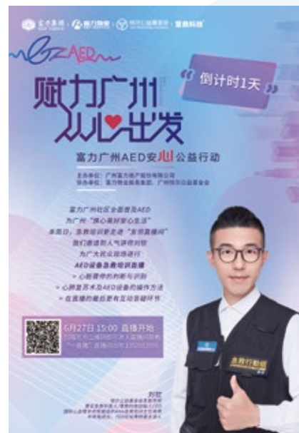
富力广州×悦尔公益 线上急救直播海报