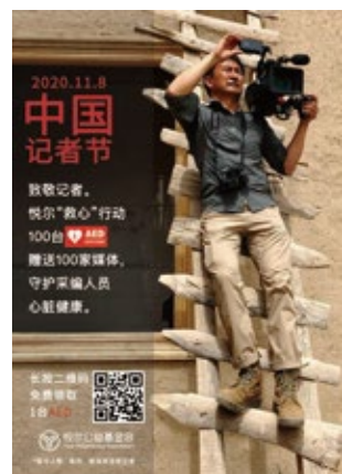
图右:中国记者节海报