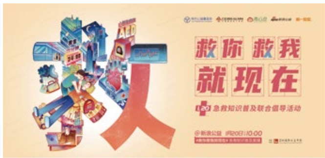
120急救知识普及联合倡导活动海报

2020年12月31日，基金会在赫基集团总部大楼-赫基大厦的竣工仪式上，开启社区场景试点，已布设2台AED并实现全体物业员工基本掌握急救技能，还将定期组织应急演练活动。