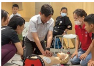
面向校友家庭 开展亲子急救培训

截至2021年8月底,悦尔“救心”行动×中欧校友会深圳分会项目立足粤港澳大湾区、面向全国,联合14家中欧校友企业,为广州、深圳、中山、西安、成都等城市新增19台AED(自动体外除颤器),并面向约800名企业员工和周边居民开展了16场急救培训。