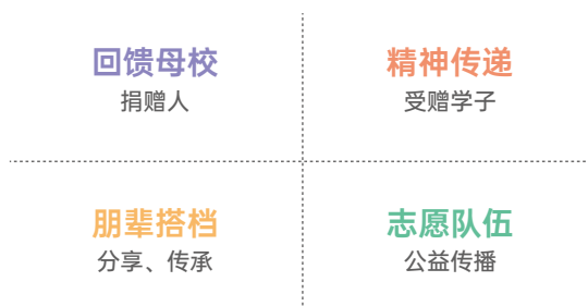
悦尔公益·宇正助学金项目执行要素