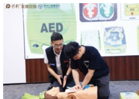
线上直播急救课程现场