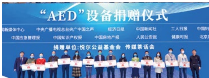
图上:在北京举行AED捐赠仪式

截至 2021 年 9 月 1 日,项目已布设 80 台 AED 设备,举办 40 场线下培训共覆盖 1763 名媒体工作者。项目现仍开放申请,并与媒体合作方持续进行互动倡导,为全国人民群众“护心”。